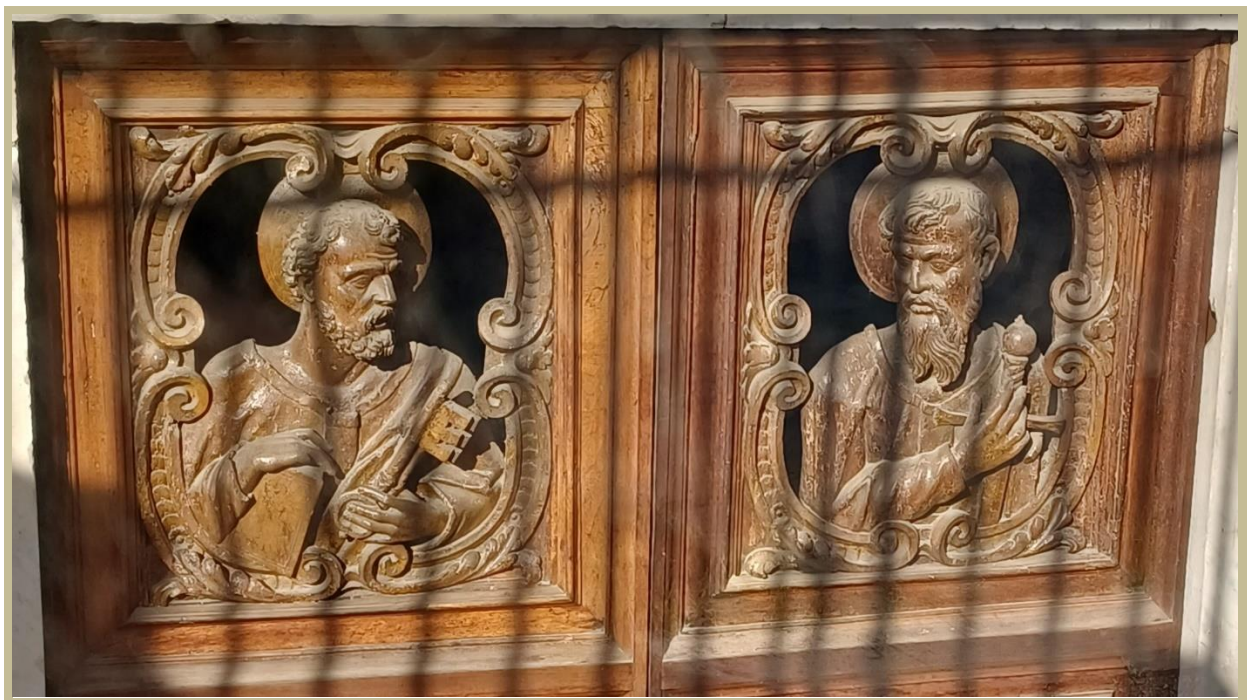
Darstellung der beiden Apostel auf einer Tür zum mamertinischen Kerker in Rom

Petrus, stell beim Hirt der Hirten für die Herd dich bittend dar, dass er suche die Verirrten und sie schütze vor Gefahr.